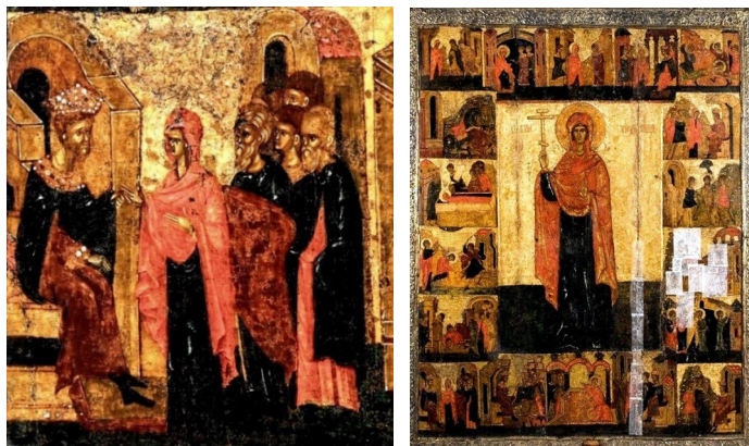
Рис. 6. «Св. Параскева перед игомном»: клеймо иконы «Параскева Пятница с 18 житийными клеймами». Из церкви Ильи «Мокрого» в Пскове. XV в. Государственный исторический музей

И если эмоционально заостренные подробности жития Параскевы Пятницы, как и других борющихся за истинную веру мучеников, в иконографии юго-западной Руси обусловлены конфессиональным противостоянием католической экспансии, в северорусской иконе Параскевы с 18 клеймами жития (рис. 6), самой ранней житийной иконе мученицы Параскевы на этой территории, подробный рассказ о деяниях почитаемой святой, их насыщенный драматизм, вызваны необходимостью обороны в Новгороде и Пскове основ православия от ереси стригольников [8, с. 133].