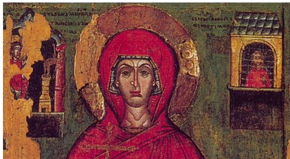
Рис. 3. Параскева Пятница с двумя сценами жития из с. Кульчицы. Фрагмент иконы. Конец XIV — начало XV в. в. Юго-Западная Русь

преподобномученицы Параскевы Римской и представленный в ее иконах из села Исаяи XIV в. [10, с. 143] и в иконе рубежа XV—XVI вв. [Там же, с. 145] (рис. 4).