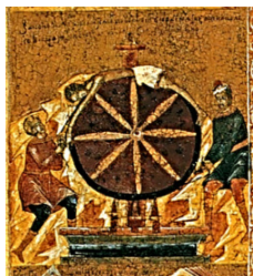
Рис. 14. «Мучение Параскевы на колесе»: клеймо иконы «Мученица Параскева Иконийская, с житием». XVII в. Из частного собрания