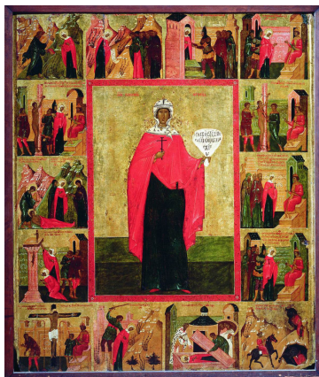
Рис. 9. «Пророк Еремей наставляет Параскеву»: клеймо иконы «Параскева Пятница, с житием» XVI в. Музей-заповедник «Дмитровский кремль»

В некоторых среднерусских иконах, очевидно с целью придать жизненному пути св. Параскевы глобальный церковно-исторический характер, продемонстрировать преемственность ее нравственного подвига с ветхозаветной традицией, житийный цикл открывается сценой наставления Параскевы в вере пророком Иеремией, которая отсутствует в житии Параскевы Пятницы (рис. 9). Не повлияли ли на появление этого умозрительного эпизода сюжеты более ранних западнорусских икон св. Параскевы? К примеру, в клейме иконы «Параскева Тырновская в житии» на аскетическую жизнь святую благословляет иерарх Еремей (Иеремия?), также не упоминающийся в известных вариантах ее жития (рис. 10) [2, с. 381].