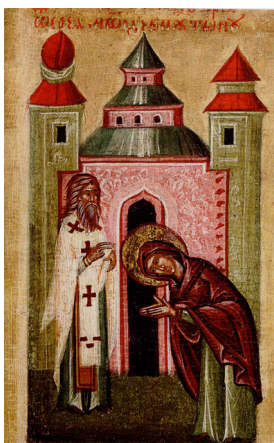
Рис. 10. «Св. Еремей благословляет Параскеву»: клеймо западнорусской иконы XV в. «Параскева Тырновская в житии»