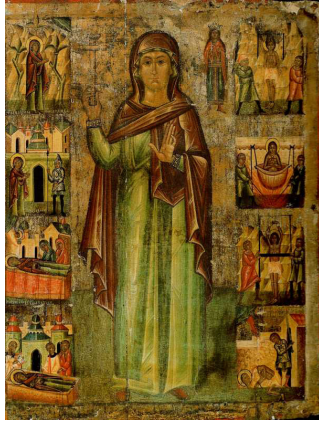
Рис. 5. «Чудо св. Параскевы о Змие»: клеймо иконы «Великомученица Параскева Пятница со сценами жития» XV в. [2, s. 371]. Юго-Западная Русь

вы I в. В клейме иконы Параскевы Пятницы XV в. из Музея народной архитектуры в польском Саноке [2, s. 371] (рис. 5) показан эпизод «Чудо о Змие», отсутствующий в житии иконойской святой, но представленный в тексте жития Параскевы Римской.