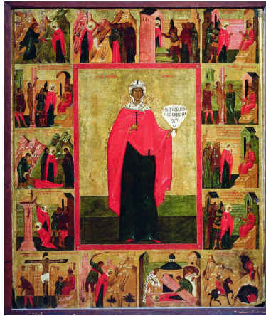
Рис. 13. «Явление Параскеве Ангела и Богоматери с орудиями страстей»: клеймо иконы «Великомученица Параскева Пятница, с житием». XVI в. Музей-заповедник «Дмитровский кремль»

На начальном этапе живописной агиографии Параскевы определяющую роль играли тексты житий — ее и, отчасти, соименных ей святых. В русских иконах XVII в. мастера обращаются к истязаниям великомученицы, не упомянутым в ее житиях, но представленным в житийных клеймах других прославленных мучеников — Георгия, Екатерины, и изображают, в частности, мучение на колесе (рис. 14) [9, с. 104—105]. Иконописец манипулирует визуальными цитатами, опираясь на закрепленные иконографической традицией ассоциации.