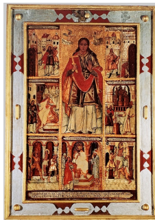
Рис. 17. «Параскеву мучают жилами говяжьими», «Параскева перед царем»: клейма иконы белорусской школы «Параскева с житием» 1659 г.

Составитель программы белорусской иконы «Параскева с житием» 1659 г. [5, илл. 54], интеллектуал эпохи барокко — эпохи театра, архитектурных и живописных иллюзий, — все семь клейм жития великомученицы выстраивает по образцу страстных икон Спасителя (рис. 17). Те тенденции иконографического творчества, которые на протяжении поколений формировали изобразительные ассоциативные ряды, конгениальные вербальным смыслам, в завершающую эпоху восточнославянской иконописи выстраиваются в практически незамаскированное «театральное» действие с подменой главных действующих лиц. Метаморфоза иконографической программы житийных икон мученицы Параскевы завершилась.