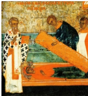
Рис. 8. «Положение тела св. Параскевы во гроб»: клеймо иконы «Великомученица Параскева» с житием конца XVI в. Дом-музей П. Д. Корина (филиала ГТГ)