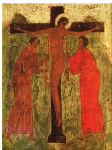
Рис. 15. Клеймо иконы «Мученица Параскева в 12 клеймах жития». XVI в. Псковский музей-заповедник