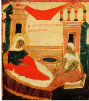
Рис. 7. «Рождество св. Параскевы»: клеймо иконы «Параскева Пятница с клеймами жития» первой трети XVI в. Центральный музей древнерусской культуры и искусства им. Андрея Рублева

включают их в иконный рассказ по аналогии со сценами жития Богородицы и прославленных святых, стремясь показать его целостный, завершенный характер 1 (рис. 7, 8).