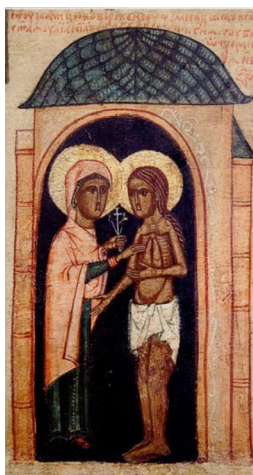
Рис. 12. «Явление Параскеве «светлой жены»: клеймо западнорусской иконы XV в. «Параскева Пятница со сценами жития»

В ранних описаниях страданий великомученицы важное место занимает сцена явления «изъязвленной до костей» Параскеве в темнице тезоименной ей «лучезарной жены» с орудиями мучений Христа. Омыв «стершей грех Адамов» губкой раны и язвы, «общница Христовым страстям» полностью исцеляется [4] (рис. 12). Этот сюжет недвусмысленно уподобляет мученический подвиг Параскевы страданиям Спасителя. Заметим, что в среднерусских иконах Параскевы XVI и XVII вв. сложно поддающийся обыденному толкованию поэтико-метафорический образ «лучезарной жены» — персонификации Страстной Пятницы — трансформируется, мистическая сцена чуда превращается в многолюдный эпизод с участием Богородицы и ангелов (рис. 13). В дальнейшей эволюции сюжета, представленной в середине XVI в. в Минеях митрополита Макария [3, с. 1972—1979], а в конце XVII в. — в «Житиях святых» Димитрия Ростовского [6, с. 584—590], чудо исцеления совершает ангел, что нашло отражение в агиографических циклах.