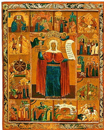
Рис. 11. «Родители приводят Параскеву поклоняться иконам»: клеймо иконы «Великомученица Параскева Пятница, с житием» второй половины XVII в. Из частного собрания