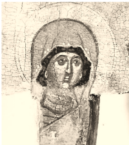
Рис. 2. Великомученица Параскева Пятница: фрагмент нижнего медальона оборота креста. Начало XV в. Юго-Западная Русь